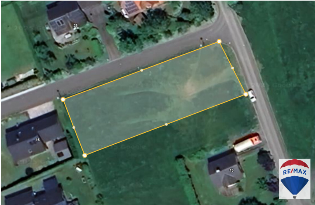
Grundstück Google Earth